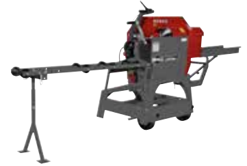
Kappsäge KS 700 E (90190)