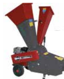
Gartenhäcksler GSB 20 Woody (94502)