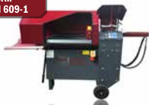
Kurzholzspalter liegend SM 301 (230 V) (91292)