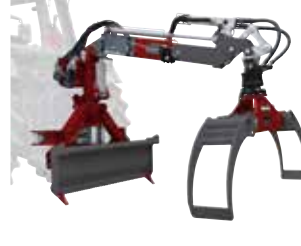
Holzrückezege HRZ Lader (96250)