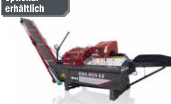
Kettensägeautomat KSA 455 EZ (90926)