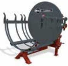
Verpackungs-System HBG 100 HS (90128)