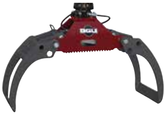
Greifer HVG 1300 (96315)