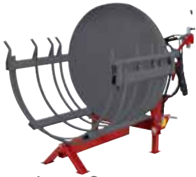
Verpackungs-System HBG 100/2 (90101/2)