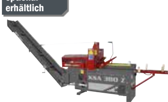
Kettensägeautomat KSA 380 Z (91916)