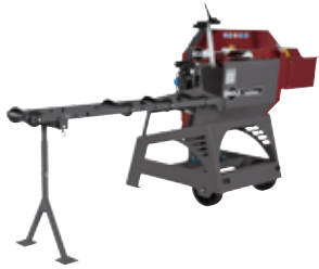
Kappsäge KS 600 (230 V) (90192)