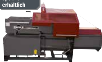
Säge- & Spaltmaschine SSM 271 Z (95051)