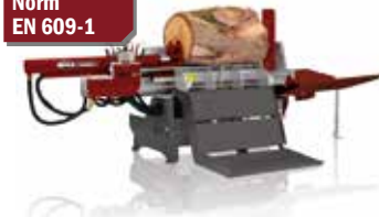
Langholzspalter liegend SP 30 HEH/2S (93672)