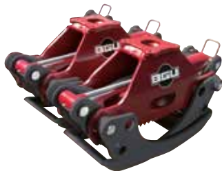
Greifer HG 1300 (96314)