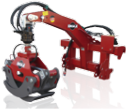
Holzrückezege HVZ 1300 (96243)