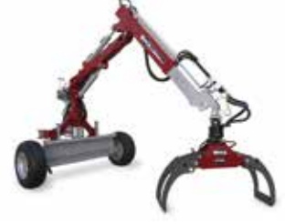
Holzrückezege HRK (96300)