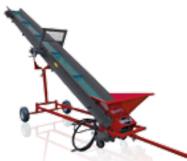
BGU Förderband TFB 4000 (92206)

Antrieb optional: hydraulisch mit Hydromotor oder E-Motor