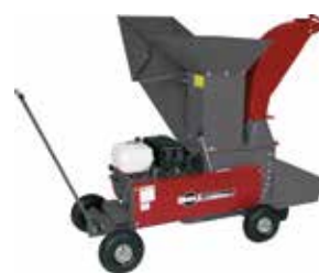
Gartenhäcksler GSB 242 Combi (94562)