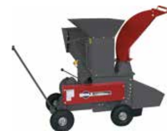
Gartenhäcksler GSE 242 Combi (94554)