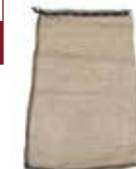
Netzsack mit Zugband für PS 300 (91921)