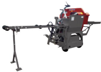
Kappsäge KS 700 H (90191)