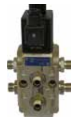
Umschaltventil für 2 Funktionen (96270)