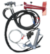
Hydr. Zylinder Spannvorrichtung HBG 100/2 (90224)