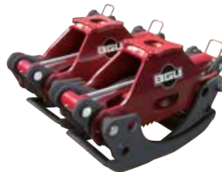
Greifer HG 1700 (96316)