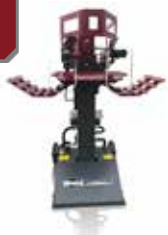
Kurzholzspalter HS 71/2 (230 V) (91278)