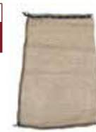
S/I Netzsack mit Zugband für PS 1000 (91923)