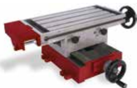
Kreuzsupport 400 mm Aufspanntisch (90497)