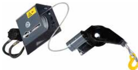
Hydraulische Seilwinde ASW 1850 F (96365)