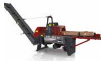
Kettensägeautomat KSA 385 EZ Select (90985)