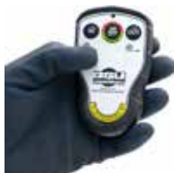
Hydraulische Seilwinde ASW 1850 F (96370)