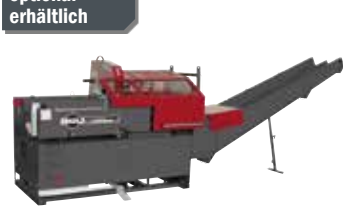
Säge- & Spaltmaschine SSM 270 EZ (95048)