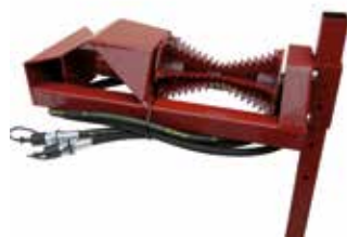
Hydraulische Einzugrolle für HZB 3000 HL (90008)