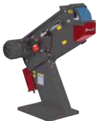
Metallbandschleifer MBS 1501 (90560)