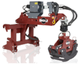
Holzrückezege HRZ Fix-Euro/Kombi (96240)