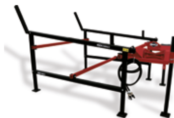
Holzzuführbock HZB 3000 HL (90011)