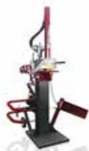
Langholzspalter stehend USP 13 HZ/7 (93623)