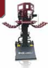
Kurzholzspalter HS 61/3 Tornado (91323)