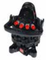
Rotator 4,5 t (96255)