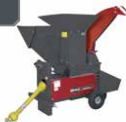
Gartenhäcksler GSZ 242 Combi (94556)