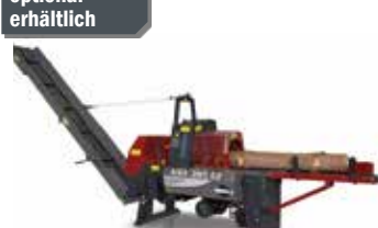
Kettensägeautomat KSA 385 Z Select (90986)