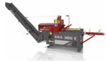
Kettensägeautomat KSA 380 E (91915)