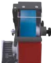
Metallbandschleifer MBS 751 (90550)