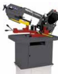
Metallbandsäge BSM 190 G (90716)