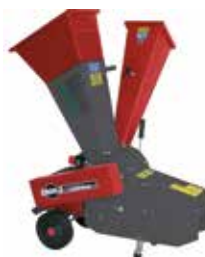
Gartenhäcksler GSE 20 Woody (94500)