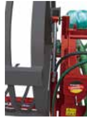
Hydraulikzylinder doppelwirkend für HBG 100/2 (90211)