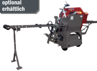
Kappsäge KS 700 Z (90189)